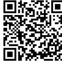
QR для Telegram-бота